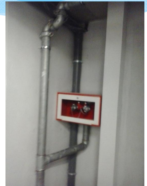
INSTALACION RED CONTRAINCENDIOS PARKING DIAGONAL