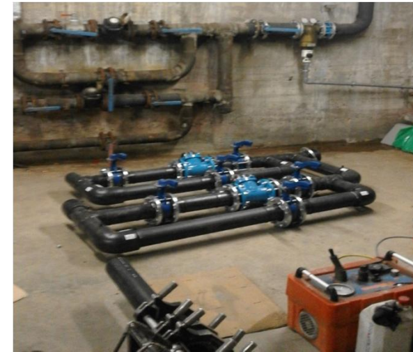
SUSTITUCION DE CONTADORES Y ACOMETIDA CENTRO COMERCIAL MONTIGALA