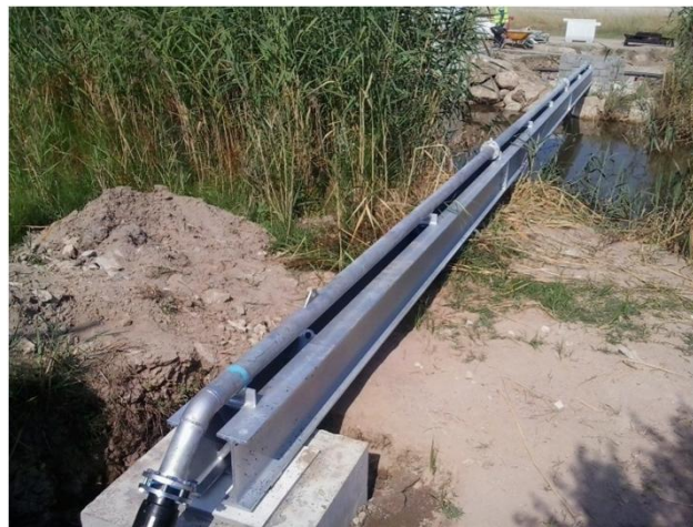
PASO ZONA CANAL PARA SUMINISTRO AEROPUERTO DE ELPRAT