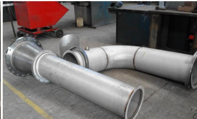
FABRICACION EN INOX. AISI 316 PARA ING. INCLAM SISTEMA DE AGUA POTABLE PARA CATACAMAS (HONDURAS)