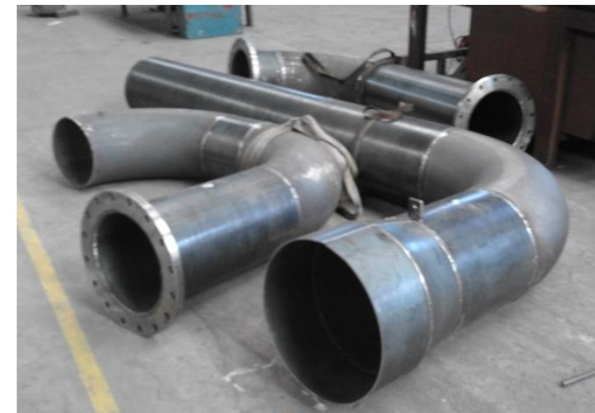
FABRICACION Y GALVANIZADO EN CALIENTE PARA ING. INCLAM SISTEMA DE AGUA POTABLE PARA CATACAMAS (HONDURAS)