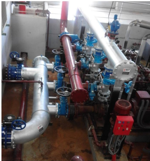
CAMBIO DE COLECTORES ASP. E IMP. ZONA AENA AEROPUERTO EL PRAT

ESPECIALISTAS EN MONTAJE DE Tubería RANURADA ,CONSTRUCCIÓN DE EQUIPOS DE IMPULSION Y DEPOSITOS.