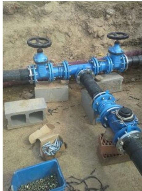
SUMINISTRO AGUA POZOS LA RICARDA AEROPUERTO DE ELPRAT