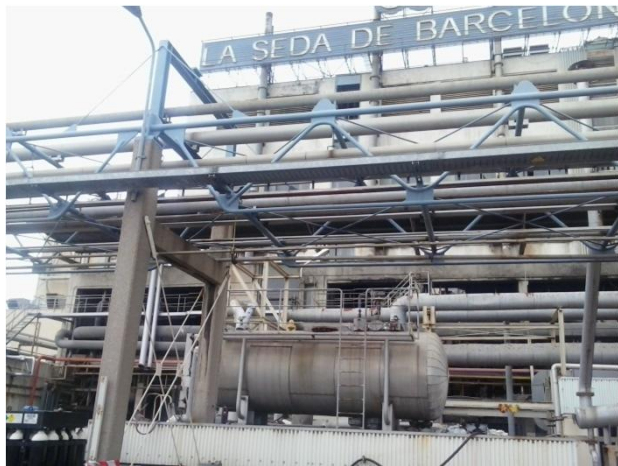
AMPLIACION LINEA RECEPTORA DE GAS EN PLASTIVERD

EN NUESTROS TALLERES DISPONEMOS DEL EQUIPO TECNICO ESPECIALISTAS EN PIPING, ASÍ COMO EQUIPOS DE SOLDADORES HOMOLOGADOS