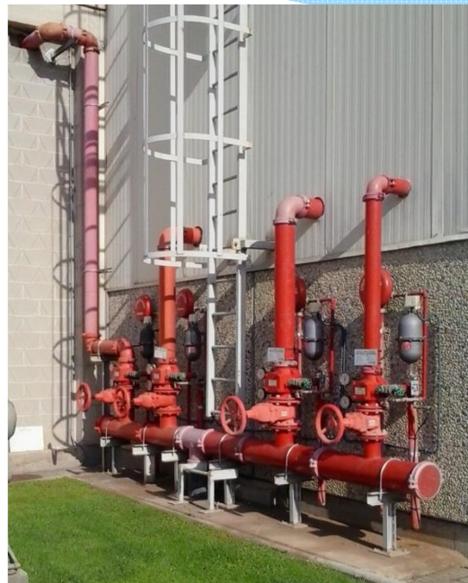
MANTENIMIENTO COLECTOR E INSTALACIONES SEGUR FUEGO