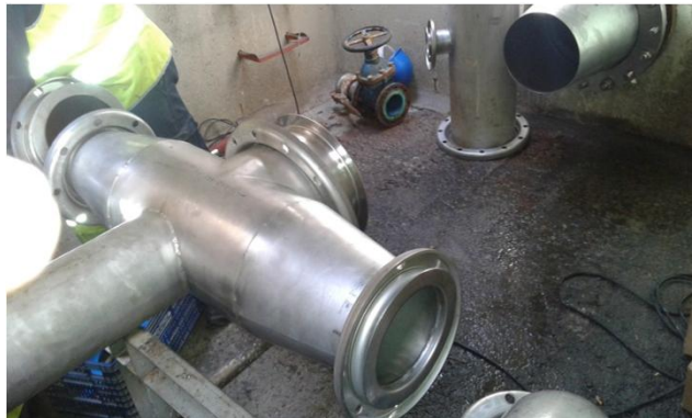
CONEXIÓN GRUPOS DE BOMBEO TERMINAL T1 AEROPUERTO DE ELPRAT

EN NUESTROS TALLERES DIPONEMOS DEL EQUIPO TECNICO ESPECIALISTAS EN PIPING, ASÍ COMO EQUIPOS DE SOLDADORES HOMOLOGADOS